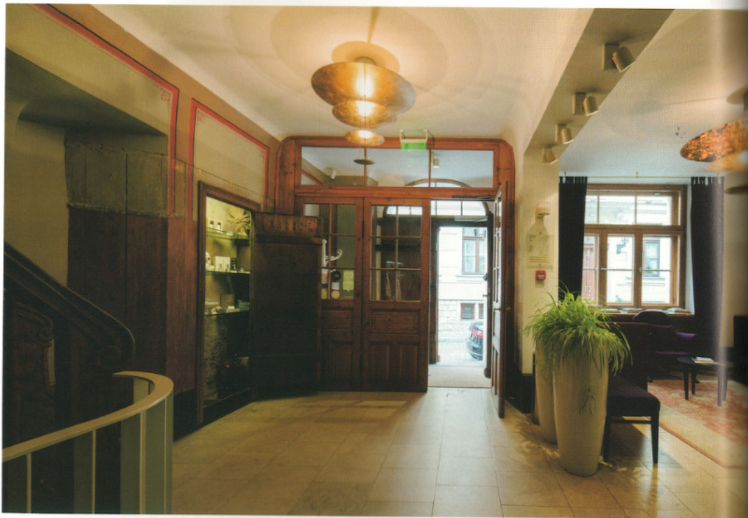
This page: Looking towards outside from the entrance lobby. Delicate hand drawings and the existing wooden structure welcome the guest. Opposite: Exterior view from the street.

本頁：エントランスホールから街路を見る。手書きの繊細なペインティングと既存の木の構造がゲストを迎える。右頁：通りから見た外観。