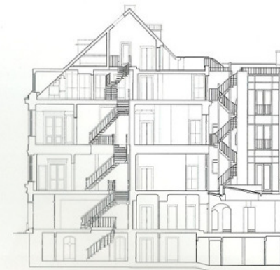
Section (scale: 1/400)/断面図（縮尺：1/400）

建築デザインのコンセプトは、歴史的要素の保存と復元、現代的なデザインによる解決と高級ホテルの特色である十分な快適性を満たすことのバランスを維持することに基いている。歴史的価値にたいして繊細なアプローチは建物の階所に見られる一歩進んだ階段、扉、窓、壁面に描かれた模様は17世紀の模様の復元である。新たに付け加えられた4層分のヴォリュームと中庭の垂直なグリーンウォールは、このプロジェクトでもっとも重要な現代建築への貢献である。15の客室に共通する特色は、日光を最大限に利用して、機能的かつ趣味的な良い配置に仕上げたことである。（松本晴子訳）